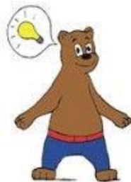
Hoe ga ik het doen?