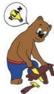
Ik doe mijn werk