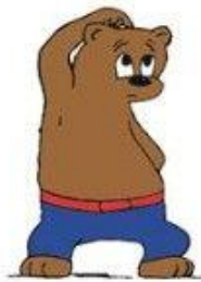
Wat moet ik doen?