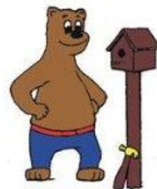
Ik kijk mijn werk na. Wat vind ik ervan?